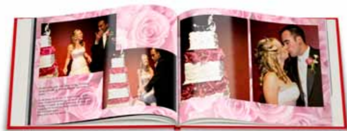
De mooiste dag van je leven in een romantisch fotoboek!