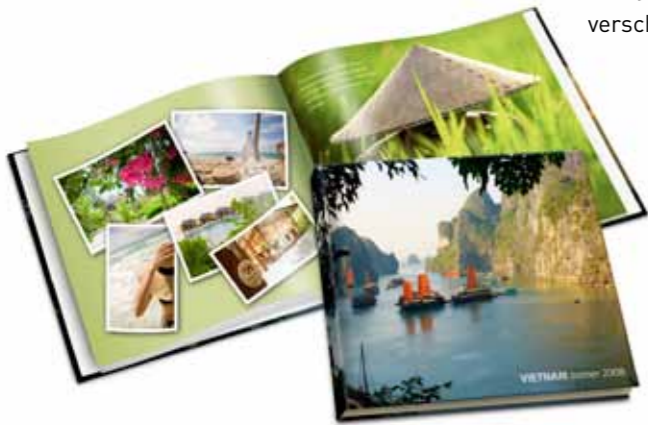
Een onvergetelijke reis ...

Hier zijn alvast een paar voorbeelden van recente Albelli fotoboeken met verschillende thema's. Zo krijg je een idee hoe jouw fotoboek er uit kan zien!