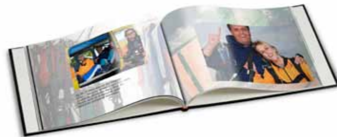
Een memorabele sportervaring