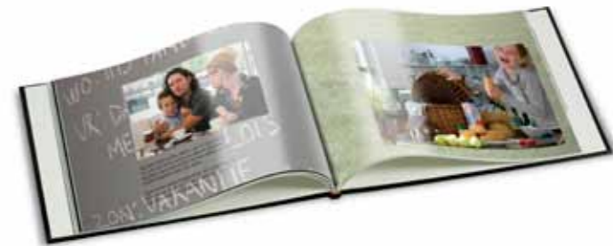
Koester leuke familiemomenten