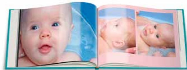
Bundel de onvergetelijke foto's van je kinderen