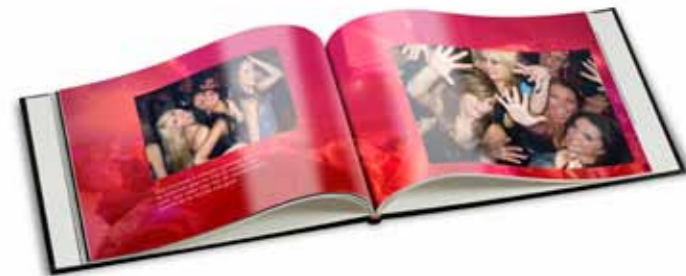
Verras je vrienden met een leuk cadeau